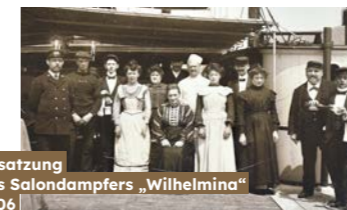
Besatzung des Salondampfers „Wilhelmina“ 1906

Heute arbeiten mehr und mehr Frauen auf Rheinschiffen, doch noch immer bleibt die Branche vorrangig „Männer-sache“. Dabei haben Frauen eine lange aktive Rolle in der Arbeitswelt der Binnenschifffahrt.