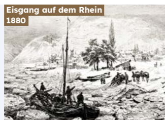
Eisgang auf dem Rhein 1880

Dicke Eisschollen und ein zugefrorener Rhein war früher nichts Ungewöhnliches. Berichte von zerdrückten Schiffen und wagemutigen Kindern erinnern uns an ehemals eisige Winter.